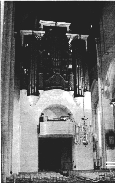
Walckerorgel in de Martinikerk te Doesburg