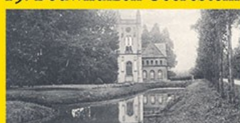
20. Klein Geerestein