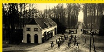
19. Bouwhuizen Geerestein