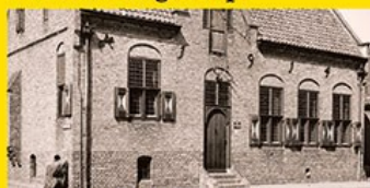
12. 't Schoutenhuis