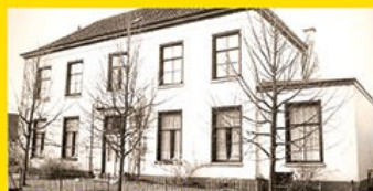
15. Oude Pastorie