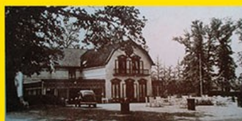
2. Hotel De Schans