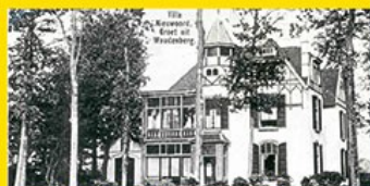
10. Huize Nieuwoord