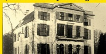
18. Ridderhofstad Geerestein