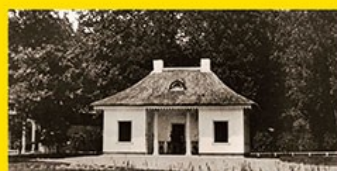
17. Kinderhuisje Heiligerlee