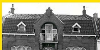
11. Pand Digishop