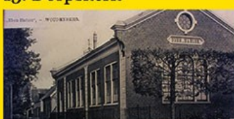
14. Eben Haezer