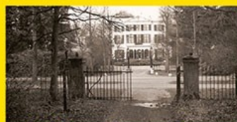
21. Hekken Geerestein