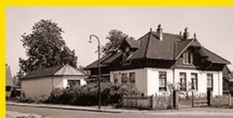
22. Wilhelmina Bewaarschool